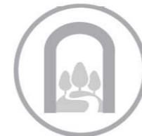
porta di accesso al parco