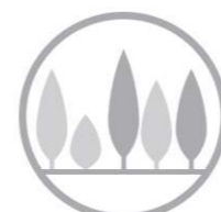
implementazione vegetazione esistente