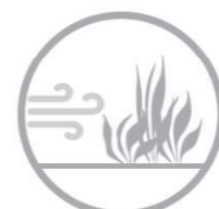
barriere vegetali frangivento