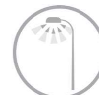
illuminazione stradale adattiva