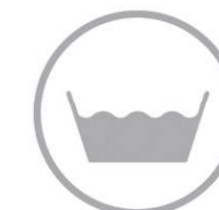
bacino di raccolta acque meteoriche